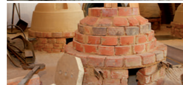
Klokkenvorm in de gietkuil