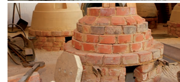
Klokkenvorm in de gietkuil