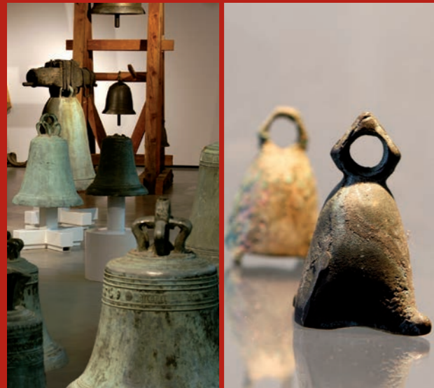
Kerkklokken & klokkenstoel

Tijdens de klinkende tijdreis kunnen bezoekers op vele manieren met het muziekinstrument, het kunstwerk en het monument "klok" omgaan.